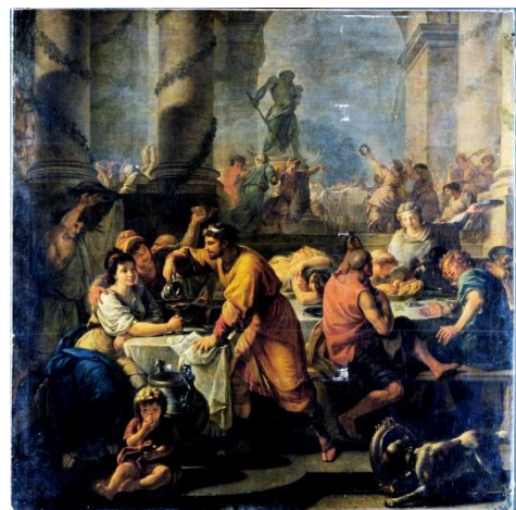
Schilderij Saturnalia door Antoine-François Callet (1783)

De rollen werden even omgedraaid : slaven waren enkele dagen vrij, ze mochten hun meesters bespotten en werden er zelfs door bediend. Er werden ook stoeten gehouden, ter ere van Bacchus, de god van de wijn.