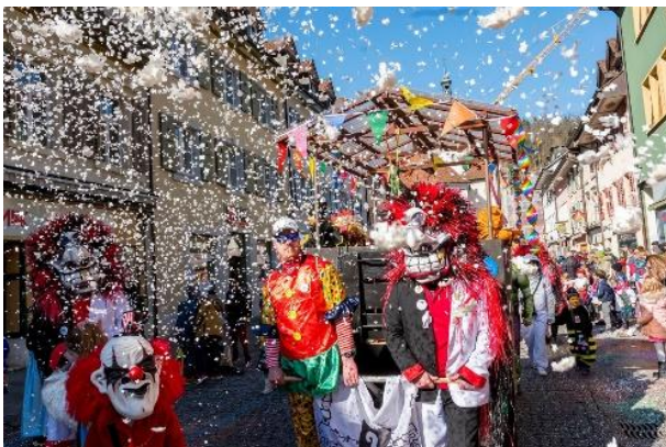
Carnaval of “Fasnacht” in Basel, Zwitserland

Vandaag bestaat Fasnacht in Duitstalige gebieden nog steeds.