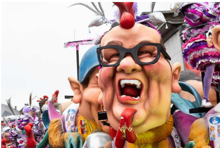
In de stoet wordt er ook veel gelachen met de burgemeester.

De pracht en praal komt ook bij de carnavals in Denderland voor. Denk maar aan de prachtige praalwagens in de stoet van Aalst Carnaval. Maar de spot, de humor zit er altijd in. De koppen uit piepschuim die op de praalwagens staan, zijn altijd karikaturen . En die karikaturen zijn niet altijd even lief voor de personen die uitgebeeld worden. En dat mag ook.