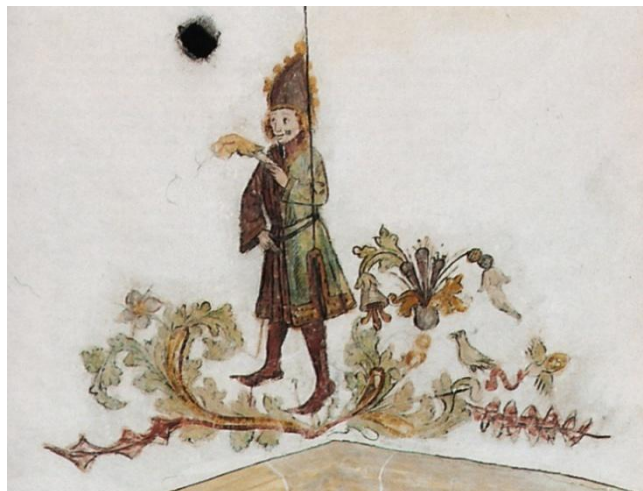
Afbeelding van een kinderbisschop uit Groningen. Hij heeft een mijter met belletjes op het hoofd en een varkenspoot in de hand in plaats van een staf.

Ook in Aalst werd een kinderbisschop verkozen. In 1474 schonk het stadsbestuur twee kannen wijn aan de school in de Kattestraat voor het organiseren van het feest.