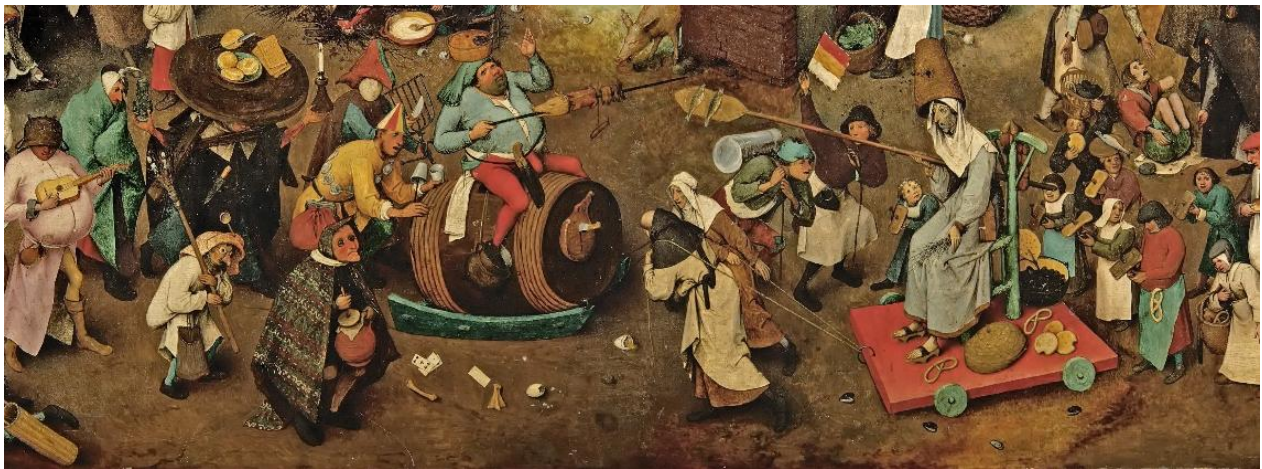
Fragment uit het schilderij De strijd tussen Vasten en Vastenavond , 1559, Pieter Bruegel de Oude. https://nl.wikipedia.org/wiki/De_strijd_tussen_Vasten_en_Vastenavond

Het steekspel was een symbool voor de strijd tussen de vasten en vastenavond , zoals ook op het schilderij van Pieter Bruegel de Oude wordt getoond.