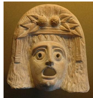
Dionysosmasker, 2 e eeuw v.C.

Iedereen mocht deelnemen aan de feesten: slaven waren tijdens deze dagen gelijk aan hun meesters, rang en stand vielen weg. De rollen werden voor even omgekeerd. Tijdens dit feest van de wijn werd er tot in de vroege uurtjes gegeten en vooral veel gedronken.