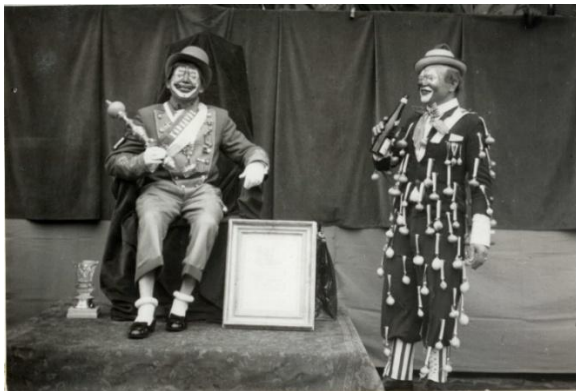
Prins Fransky en de ajuinboer.

In Aalst is er sinds 1953 een prins carnaval. Toen werd die nog aangeduid door de stad en was er nog geen verkiezing. Vanaf 1954 wordt de prins verkozen . In die eerste jaren was dat op basis van het kostuum van de prins.