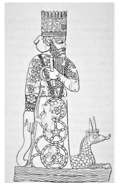
Tekening van de god Marduk