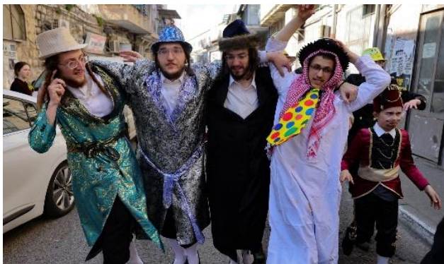
Verkleedpartij in Jeruzalem tijdens Poerim.

Het eeuwenoude Poerimfeest wordt tot op vandaag nog gevierd met verkleedpartijen , rijkelijke maaltijden, lawaai en vaak ook veel alcohol.