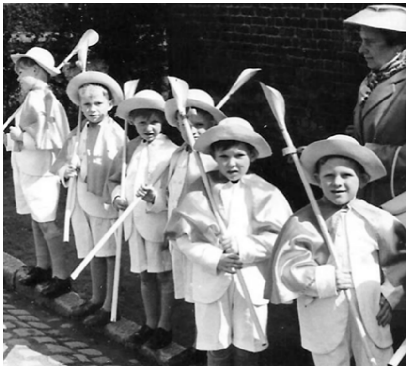
Processie in Aigem met herdertjes, 1960.

Doorheen de jaren was de Ploj het decor van tal van feesten en tradities . En ook vandaag kan je er de sfeer opsnuiven in één van de cafeetjes.