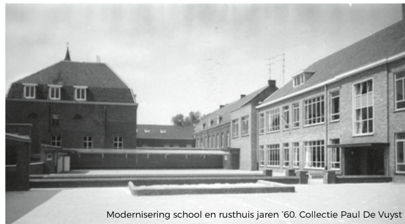
Modernisering school en rusthuis jaren '60.

Wist je dat het woonzorgcentrum Sint-Vincentius een lange geschiedenis kent?